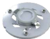
Řezací ústrojí Pro X K2