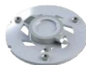
Řezací ústrojí Pro X K2