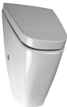
SLP 12 - VILA BEZ POKLOPU